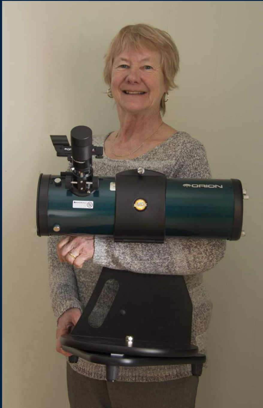
Figure 1 – Transport du télescope : tube en position horizontale; avant-bras sous le tube; instrument appuyé sur la poitrine

Placez le tube du télescope en position horizontale, passez votre avant-bras sous le tube et soulevez l'instrument en le maintenant appuyé sur le côté de votre poitrine (Figure 1).