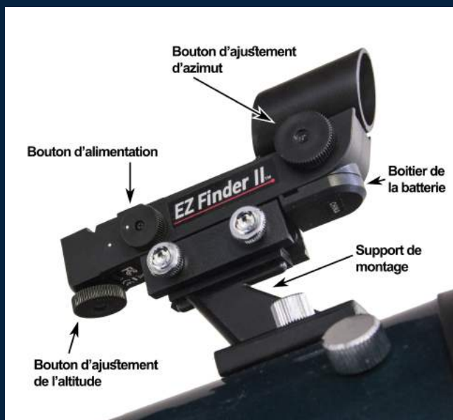
Figure 5 - Détail du viseur « EZ Finder »