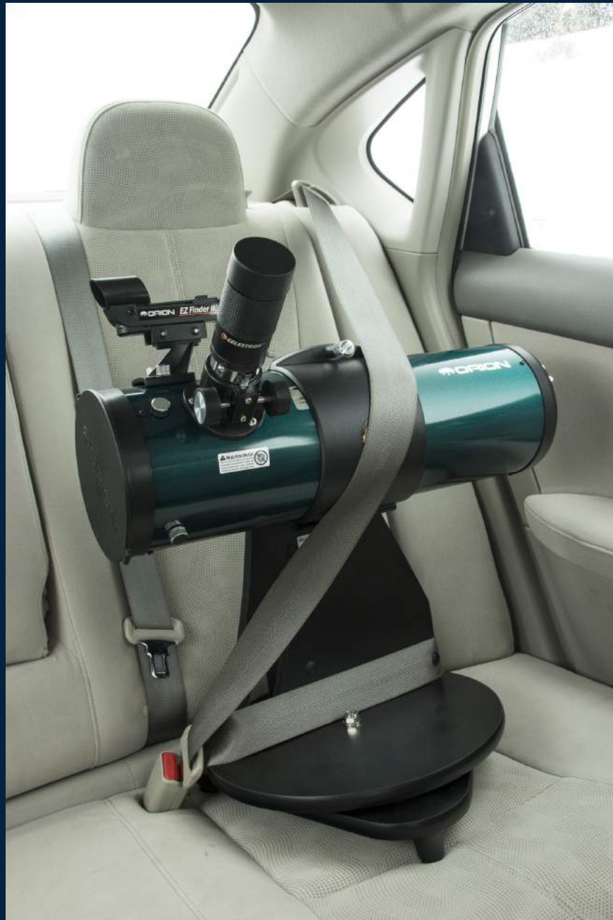
Figure 2 – Transport en voiture: instrument déposé sur le siège; ceinture abdominale serrée autour de la base; sangle de poitrine par-dessus le tube

Pour le transport en voiture, placez simplement le télescope sur un siège et attachez-le avec la ceinture de sécurité. La ceinture sous-abdominale se serre autour de la base du télescope alors que la sangle de poitrine devrait sécuriser le tube (Figure 2).